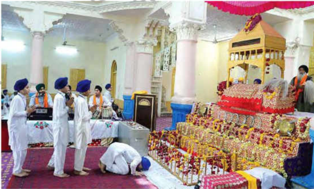
سکھ مذہب کے لوگ عبادت میں مصروف