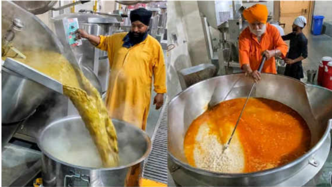
انگر کی تیاری

پر چلنا چاہیے۔ خُدا نہ ہندو ہے اور نہ مسلمان، اور میں جس راستے پر ہوں، وہ خُدا کا راستہ ہے۔“