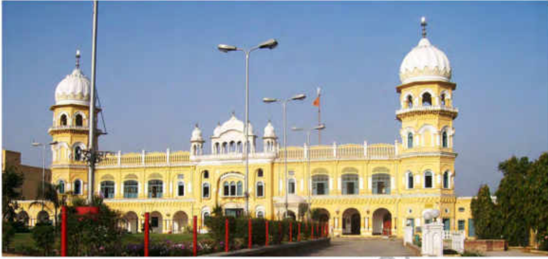
سکھوں کی عبادت گاہ: نکانہ صاحب

گورونانک صاحب جی کو ’زمانے کا عظیم ترین مذہبی موجد‘ قرار دیا جاتا ہے۔ انھوں نے دُور دراز سفر کر کے لوگوں کو ایک خُدا کا پیغام پہنچایا جو اپنی ہر ایک تخلیق میں جلوہ گر ہے اور لازوال حقیقت ہے۔ انھوں نے ایک منفرد روحانی، سماجی اور سیاسی نظام ترتیب دیا جس کی بنیاد مساوات، بھائی چارے، نیکی اور حسن سیرت پر ہے۔ سری گورونانک صاحب جی کا کلام سکھوں کی مقدس کتاب سری گورو گرنتھ صاحب میں براجمان ہے۔