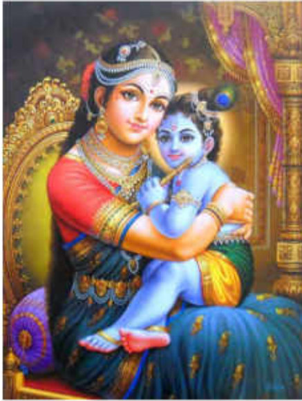
ماتا دیو کی اور بھگوان کرشن

اس وقت کے حالات کی وجہ سے شری کرشن بھگوان نے اپنے والد کے دوست نند جی کے گھر پرورش پائی۔ نند بابا جی اور اس کی بیوی ماتا یثودا نے شری کرشن بھگوان کی پرورش کی۔ انھوں نے شری کرشن بھگوان جی کو بڑے پیار سے پالا۔