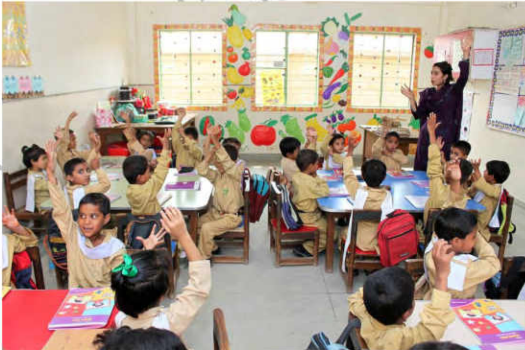
استاد تعلیم دیتے ہوئے

☆ اساتذہ کی دی ہوئی تعلیم و تربیت ہی بہتر زندگی گزارنے میں مدد دیتی ہے۔