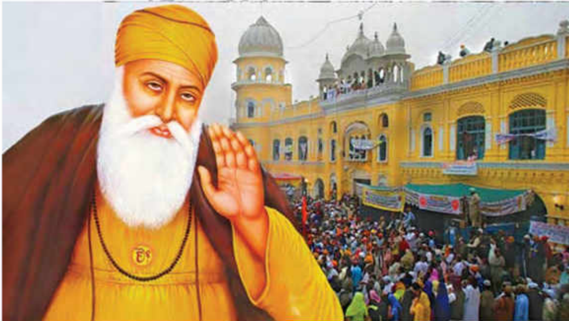
سری گورونانک صاحب جی

سکھوں کی مذہبی کتاب کا نام سری گورو گرنتھ صاحب ہے، اور اس کی تعلیمات کی پیروی کرتے ہیں۔