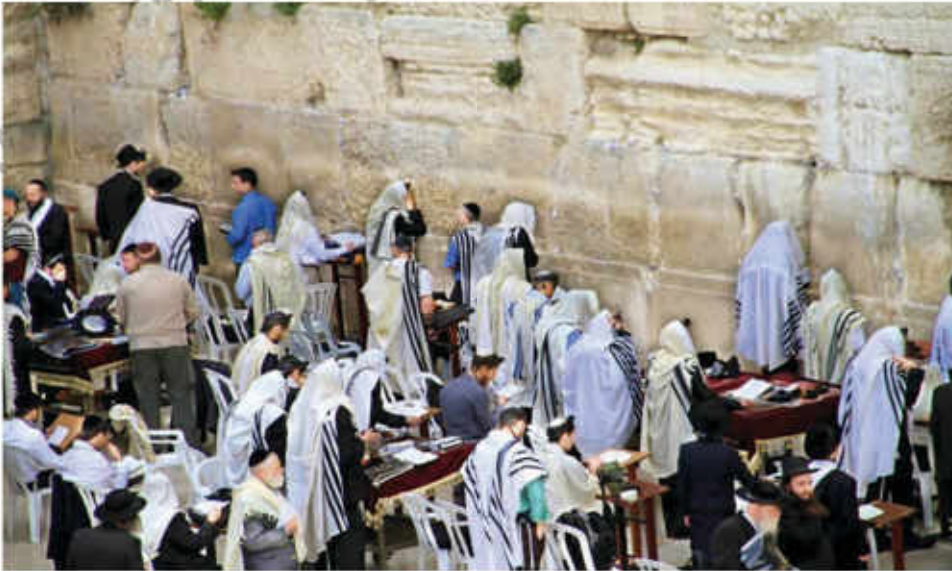
یہودیت مذہب کے لوگ عبادت کرتے ہوئے

(توریت کی دوسری کتاب جس کا نام ”خروج کی کتاب“ ہے اس کا باب نمبر 20)