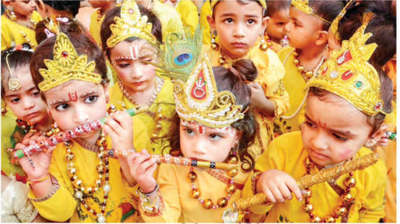
شری کرشن بھگوان کے تہوار میں شریک ہندو بچے