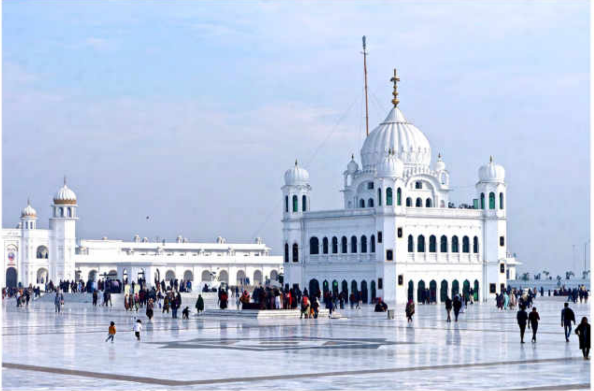
گوردوارہ دربار صاحب، کرتار پور، نارووال

پاکستان کے ضلع نارووال میں کرتار پور ہی وہ مقام ہے جہاں سکھوں کے پہلے گورو نے اپنی زندگی کے آخری ایام بسر کیے تھے۔ اسی مقام پر ان کی سادھی اور قبر بھی ہے جو سب کے لیے مقدس ہے۔ آپ نے 22 ستمبر 1539 کو دُنیا سے پردہ کیا۔