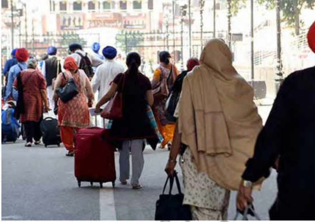
نکلانہ صاحب میں سکھ مذہب کے لوگوں کی آمد