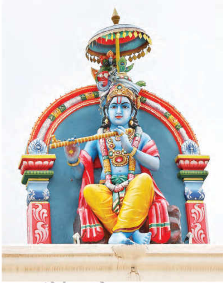
شری کرشن بھگوان