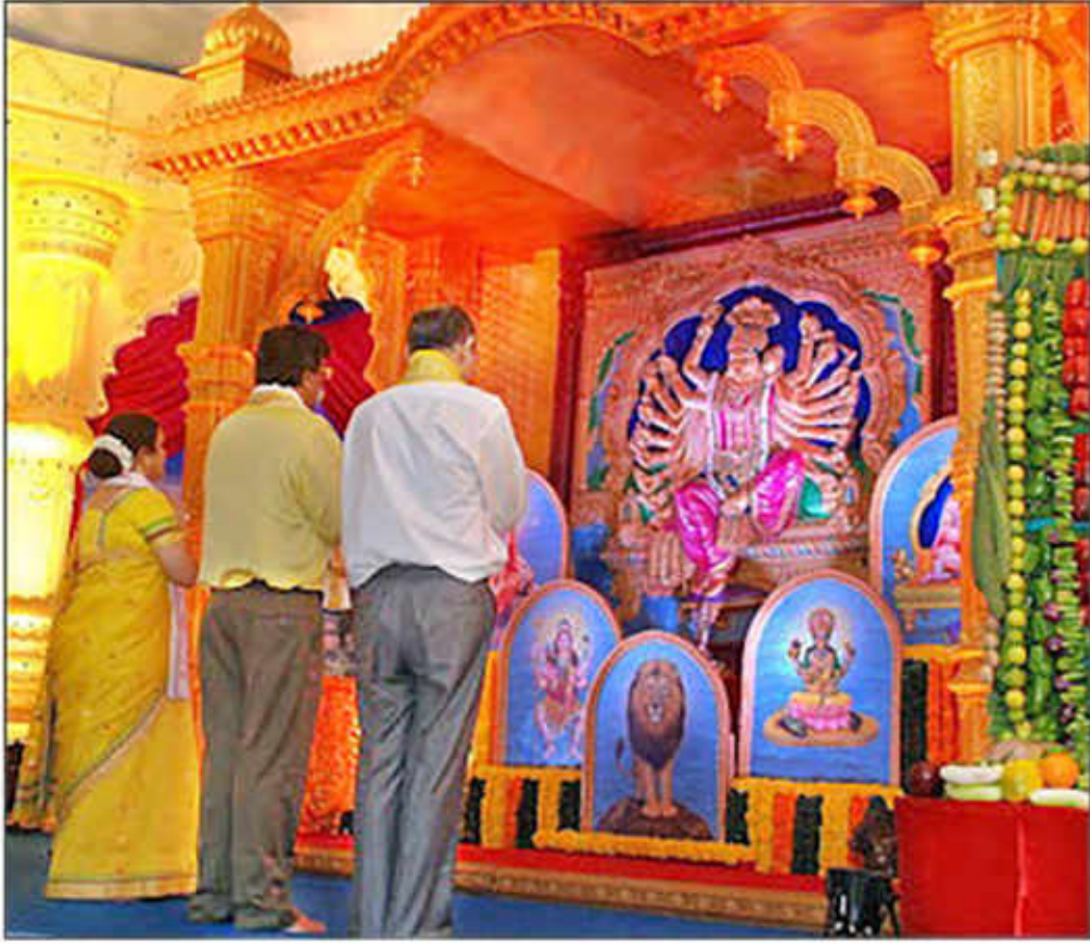
ہندو عبادت کرتے ہوئے